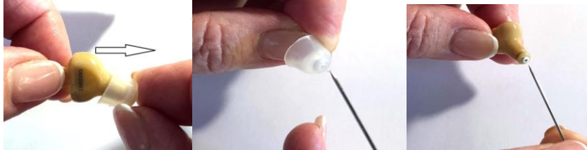
QUITAR LA SILICONA

Es pequeño y difícil de ver a simple vista.